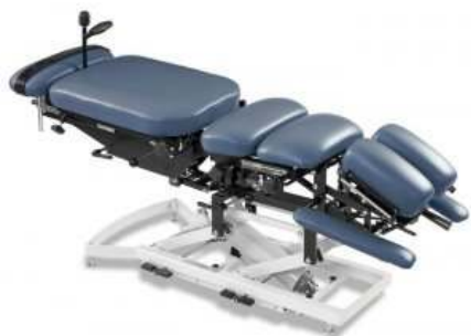
Fig.1: Notre table de flexion-distraction

Mais avant d'entrer dans le vif du sujet, il faut que vous sachiez que j'ai plus de 25 ans d'expérience en pratique et que j'ai une formation universitaire autant en décompression neurovertébrale qu'en technique Cox. De plus, j'utilise la technique Cox depuis des années en clinique, puisque nous avons plusieurs de ces tables de flexion-distraction. J'utilise également plusieurs tables de décompression neurovertébrale depuis plus de 8 ans. Donc, je sais exactement de quoi il en retourne et je n'ai aucune raison de favoriser un traitement plutôt qu'un autre. Mais j'ai horreur des fausses prétentions.