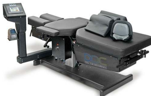
Fig 4: Notre table DOC de décompression neurovertébrale informatisée